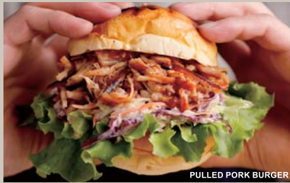
PULLED PORK BURGER