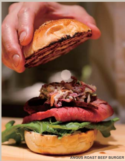
ANGUS ROAST BEEF BURGER