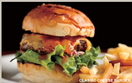
CLASSIC CHEESE BURGER